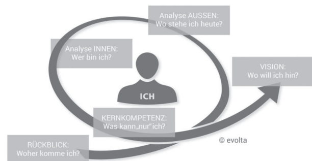
Abbildung 2: Der Personal-Strategy-Profile® Prozess (Schadler, 2013)